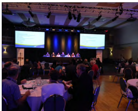
Réunion d'affaires au Palais des congrès d'Edmundston.

Les membres présents lors de l'AGA ont adopté des décisions qui auront un impact important sur les opérations et l'orientation de la CDR-Acadie au cours des prochaines années. Parmi celles-ci, notons le changement officiel du marché de la CDR-Acadie qui s'étendra dorénavant à tout le Canada Atlantique et non seulement à la province du Nouveau-Brunswick ainsi que l'augmentation du nombre de membres à son conseil d'administration qui passe de 7 à 8 membres afin de refléter cette nouvelle réalité. Ces changements doivent maintenant être approuvés par